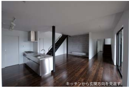
キッチンから玄関方向を見返す。

秋田県由利本荘市、国道7号線から1本裏手の敷地に建つ住宅です。住宅は車2台分のガレージをビルトインし、南側に開きつつサンルームと和室で囲み、南側のデッキをよりプライベートなものとし、デッキは庭と連続しており、その南側をコンクリート打ち放しの塀が囲い込みます。1階はLDKを中心に、和室はスキップフロア状で、1階のフロアから1,600程上がっており下部は床下収納として使用します。2階は個室のフロアとなっており、ご夫婦それぞれの寝室と子供室を有します。全体にナチュラルなテイストとは一線を画し、モダンでスタイリッシュな雰囲気を目指した住宅です。