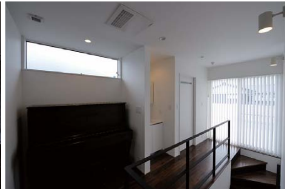
階段上部のスペースには、トイレ・洗面台・ピアノ置場を設けている。廊下の突き当たりはルーフトバルコニーとして活用する。