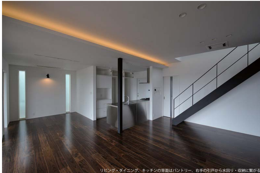
リビング・ダイニング、キッチンの背面はパントリー、右手の引戸から水回り・収納に繋がる。