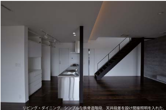
リビング・ダイニング。シンプルな鉄骨造階段。天井段差を設け間接照明を入れた。