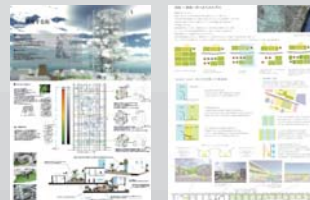
優秀賞 積層する街