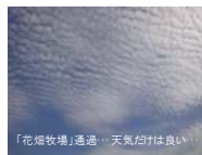
「花畑牧場」通...天気だけは良い

ちょっとお休みを頂いて「研修旅行」に行ってきました。というのも、無料往復+宿泊つき招待券が当たったのです！限研吾設計の実験モデルハウスが北海道の大樹町に完成したので、その記念サミットにどうぞ、という訳です。