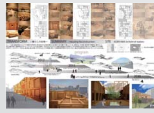
最優秀賞 TRANSFORM 暮らしの記憶