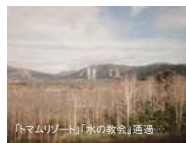
「トマリソノ」水辺の散歩