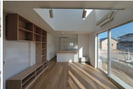
His-House II 南面のテラス窓から入る陽と合わせて、家中を明るくします。大河原のコートハウス 木質系の材料を多用し柔らかな陽を導きます。