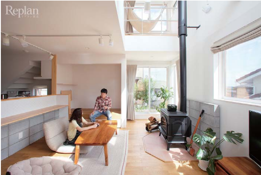
川平の家 煙突が昇る吹抜け。それほど大きな VOID ではありませんが有効に機能します。