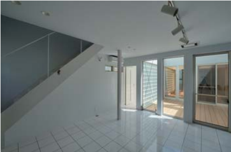
1+n こちらは外部の VOID。中庭に入る陽がそれぞれの部屋を明るくします。