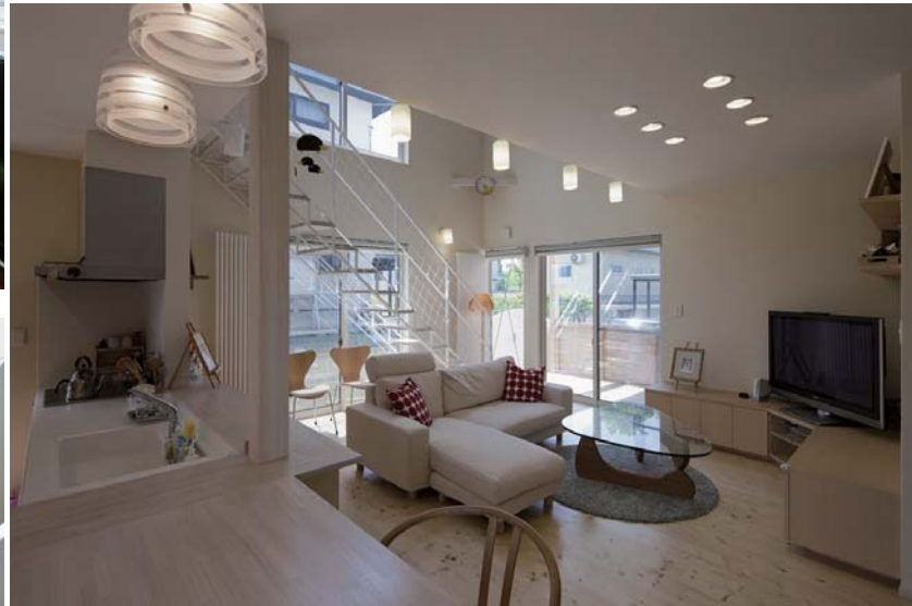
ぬくもりの我が家 階段が昇る吹抜け。軽やかな階段が光の中に浮かびます。

今回の特集は、「VOID & LIGHT・吹抜けと光」をテーマにお届けいたします。住宅に大きな彩りを添える吹抜け。下階に光を導き、上下階のコミュニケーションを育む上でも大変有効な装置の1つです。ただ、音や熱や匂いも一体化するので、メリットを裏返せばそのままデメリットにもなってしまいます。クライアントにより、その好みは大きく分かれるところでもあり、メリットとして見出せるお客様にはお勧めしております。今回は「吹抜けに差し込む光」をテーマに、暮らしの中のシーンを取り上げてみました。