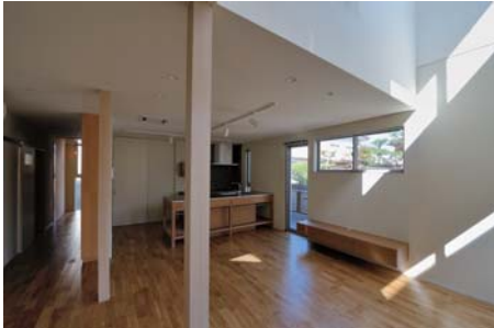
Ut-House 南側の吹抜けから斜めに差し込む陽が美しく、リビングの奥まで導きます。