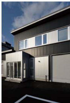
ファサード。中央は風除室。 スチール製の軽やかな階段。

秋田市内に建つ、社員 10 人程度の本社オフィスです。敷地は国道から少し入った、東側道路に面する矩形の敷地で、9 台分の駐車スペースと配送車が入れる倉庫兼バックヤードが確保されています。オフィスは2階建てで、1階はオフィス・スペース+倉庫バックヤード・水回り・収納を設け、2階は会議室・応接室・休憩室を設けています。オフィス・スペースにはセミオープンな打合せスペースが併設され、2階の会議室・応接室と合わせて、それぞれの用途に応じて使い分けます。エントランスからオフィスへ、又は2階の応接・会議室へと、社員とゲストの動線を整理し、機能的なオフィス空間であるように計画しました。ファサードは機械関係の業種ということもあり、ブラックを基調としてシルバーのブロックを配し、モダンでテクニカルな印象としています。