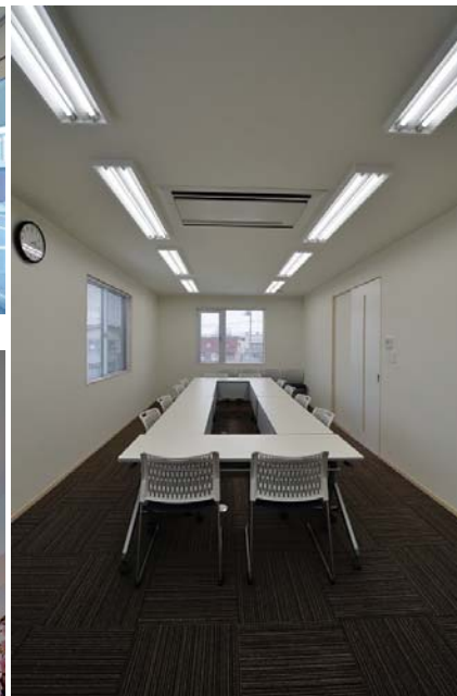
2階会議室。打合せや研修など多目的に使用される。