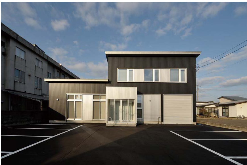
東側ファサード。外壁はガルバリウム鋼板。ブラックを基調にシルバーのブロックを配置する。

秋田市内に建つ、社員 10 人程度の本社オフィスです。敷地は国道から少し入った、東側道路に面する矩形の敷地で、9 台分の駐車スペースと配送車が入れる倉庫兼バックヤードが確保されています。オフィスは2階建てで、1階はオフィス・スペース+倉庫バックヤード・水回り・収納を設け、2階は会議室・応接室・休憩室を設けています。オフィス・スペースにはセミオープンな打合せスペースが併設され、2階の会議室・応接室と合わせて、それぞれの用途に応じて使い分けます。エントランスからオフィスへ、又は2階の応接・会議室へと、社員とゲストの動線を整理し、機能的なオフィス空間であるように計画しました。ファサードは機械関係の業種ということもあり、ブラックを基調としてシルバーのブロックを配し、モダンでテクニカルな印象としています。