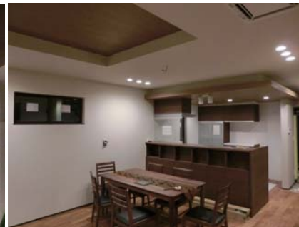
ダイニングキッチン、天井段差や間接照明を設けている。 リビングより対面式のダイニングキッチンを見る。