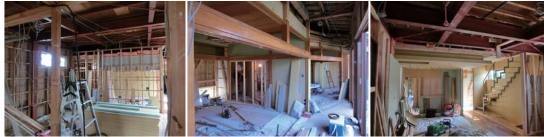
解体中の2階部分、鉄骨の構造体が見える。 解体中の平屋の1階部分、こちらは在来工法。 鉄骨造の1階リビング、階段位置も変更している。

岩手県一関市の郊外、築32年経過の店舗併用住宅のフル・リノベーションの事例です。既存建物は、2階建て部分が鉄骨造+平屋部分が木造の混構造で、当時の設計図や構造計算書は残っておらず、鉄骨構造部分はほぼ既存のままの構造体を使用する事としました。木造部分は在来軸組工法のため、現場で既存構造をチェックし適宜補強を加えながら設計を進めました。基本的には2世帯同居のためのリノベーションであったので、住宅内を大きくゾーニングしながら、近付けるべき場所・遠ざけるべき場所を設定し、それぞれの世帯の距離感を計りながらの設計になりました。メイン・リビングに加えて2階にもサブ・リビングを設置し、十分な面積の個室も設けて、それぞれ快適な居場所としました。全体的に素材感のある材料や間接照明も多用し、色彩計画も落ち着いたものとしています。