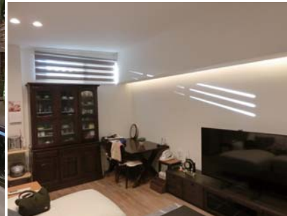
2階リビング、間接照明の正面ウォールに陽が差し込む。 玄関回り、ニッチ棚とギャラリースペース。