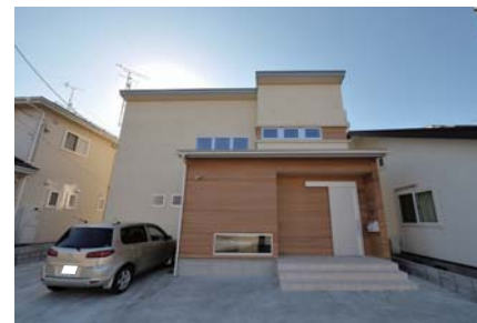
北側ファサード。アイボリーとウッドのコンビネーション。