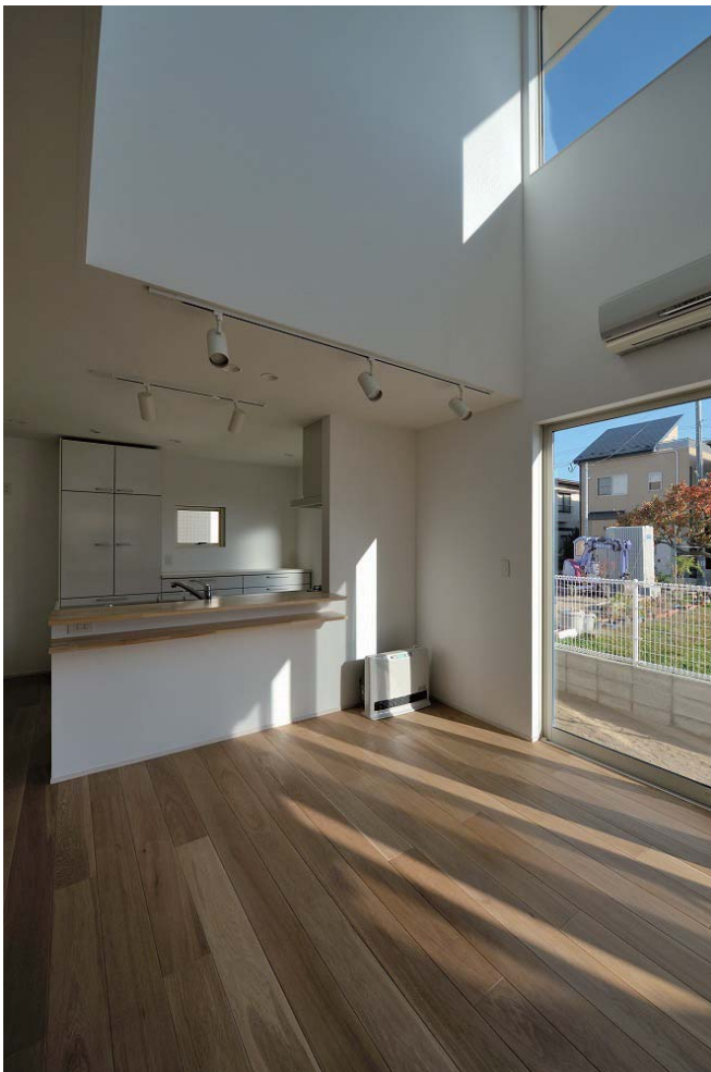
ダイニング・キッチン。南の窓から陽が差し込む。上部はフリースペースが面する吹抜け。