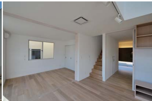
リビングと連続する多目的な予備室。必要に応じて建具で間仕切る。

秋田市内の住宅地、2005年に新築した住宅の区画整理事業による建て替え計画でした。当初より10年程度で区画整理のため解体になるかもしれないと聞いておりましたが、当時はその通りになるとは思っておらず、遠い将来の事と考えてました。敷地は現状敷地を含み、わずかに東側に移動した位置になりました。北側に前面道路という条件は変わらず、間口が狭い矩形からより正方形に近い形状となりました。その敷地に従前の住宅の記憶を継承しつつ、成長・変化した家族の暮らしに呼応する住宅として、新たにプランニングしました。共働きのご夫婦が効率的に家事をこなしくつろぎ、今後さらに成長していく子供や年齢を重ねていくご夫婦に、フレキシブルに対応するプランニングを提案させていただきました。必要な諸室に加え、リビング・ダイニングと連続する多目的な予備室を設け、吹抜けに面した2階フリースペースは子供の勉強やご夫婦の読書スペースとして活用していただきます。特に充実した玄関回りの収納スペースをはじめ、全体的に収納は多めで、これにより家全体がストレスなく片付けられるのではないかと考えます。外観は従前の黒と白のモノトーンなイメージを一新し、アイボリーの吹付けとナチュラルなウッドで、落ち着いた柔らかなイメージとしています。