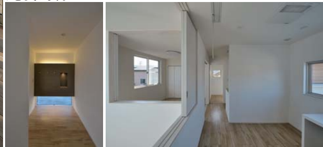
玄関ホールの間接照明。2階フリースペース。吹抜けの仕切りは可動式。