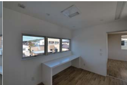
フリースペース。北側だけが安定した明るさが得られる。