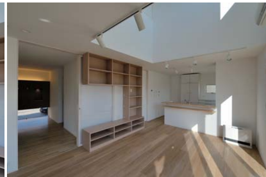
リビング・ダイニング。左手奥は玄関方向。床はオーク無垢フローリング。

秋田市内の住宅地、2005年に新築した住宅の区画整理事業による建て替え計画でした。当初より10年程度で区画整理のため解体になるかもしれないと聞いておりましたが、当時はその通りになるとは思っておらず、遠い将来の事と考えてました。敷地は現状敷地を含み、わずかに東側に移動した位置になりました。北側に前面道路という条件は変わらず、間口が狭い矩形からより正方形に近い形状となりました。その敷地に従前の住宅の記憶を継承しつつ、成長・変化した家族の暮らしに呼応する住宅として、新たにプランニングしました。共働きのご夫婦が効率的に家事をこなしくつろぎ、今後さらに成長していく子供や年齢を重ねていくご夫婦に、フレキシブルに対応するプランニングを提案させていただきました。必要な諸室に加え、リビング・ダイニングと連続する多目的な予備室を設け、吹抜けに面した2階フリースペースは子供の勉強やご夫婦の読書スペースとして活用していただきます。特に充実した玄関回りの収納スペースをはじめ、全体的に収納は多めで、これにより家全体がストレスなく片付けられるのではないかと考えます。外観は従前の黒と白のモノトーンなイメージを一新し、アイボリーの吹付けとナチュラルなウッドで、落ち着いた柔らかなイメージとしています。