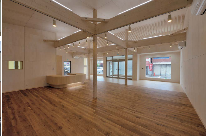
オーク無垢フローリング、シナ合板の壁・天井、天井の高さを確保し、構造体を表わしとしている。正面のトップサイドライトからの光は、木製ルーバーを通して売場全体に明るさをプラスする。