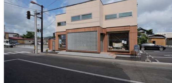
バス通りに面するファサード、柔らかな色彩と米スギ・GBによるデザイン構成。

内部仕上げは、床のラフなオークフローリング、壁・天井のシナ合板張りなど、木質系の材料を多用し、力強さを覆うフィルターとして柔らかな印象も演出します。バス通りから、ほとんど引きのない状況で建つため、外部の色彩も暖色系の柔らかなものとし、下部の米スギ材や視線をコントロールするガラスブロックがファサードを印象付けます。