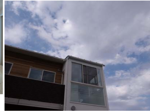
仙台市若林区OM-House プライベート感のあるLDKを演出する都市住宅

今回の特集では、昨年 12 月から今年の 4 月にかけて完成した住宅をご紹介します。完成時期がお引越しやお引渡しの間際だったり、タイミングが合わず完成写真が未だ撮れていない住宅もあります。今後写真撮影をして順次それぞれご紹介していきたいと思います。