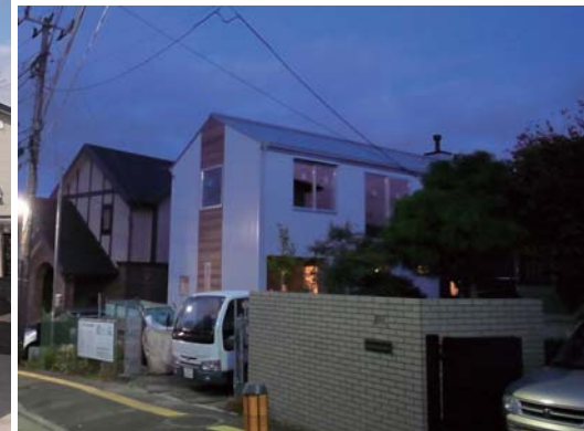
仙台市青葉区SS-House 高台に建つコンパクトに暮らしを楽しむ家