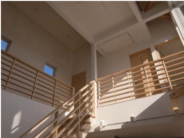
宮城県大河原町JH-House デッキを囲いそれぞれの居場所のある家