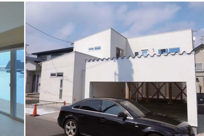
秋田県秋田市KZ-Houseガレージ 以前に設計させていただいた住宅のガレージ増築