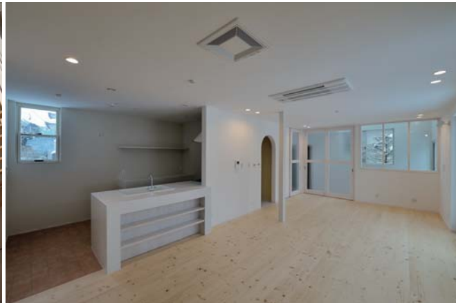
秋田県秋田市TK-House 通り土間が内部と外部を繋ぐ遊びのある住宅