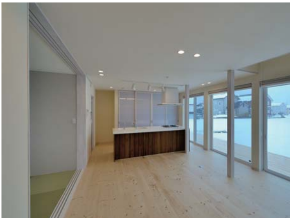
岩手県花巻市TM-House L型デッキが囲うおおらかな家事楽の家