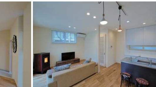
ダイニングからリビングを見る。光庭からの明るさを感じられる。ダイニング・キッチン。造り付の食器棚と通風用の小窓。