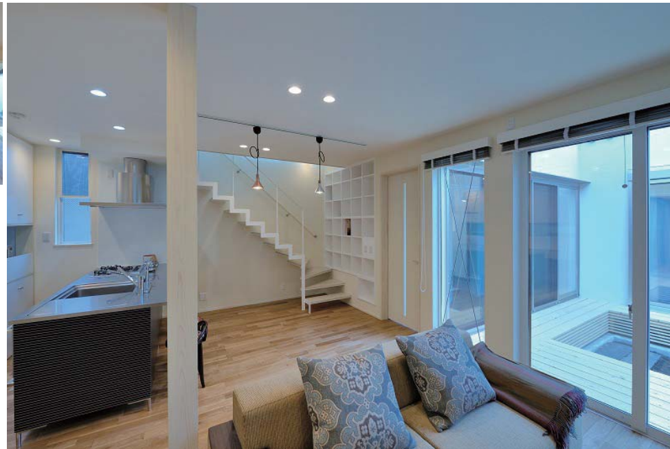
リビングからダイニング方向を見る。オープンキッチンの奥に階段と埋込本棚。右外部に光庭。仕上げ材はオーク無垢フローリングと珪藻土塗壁。

平屋へ続く通路。右手に光庭。LDの埋込型の本棚。仙台市若林区に建つ住宅です。敷地は集合住宅等も混在する住宅地に位置し、南側は3階建てマンション、北側は幅員2.7mの水平道路という厳しい条件でした。敷地は東西に横長で、南北の奥行は十分とは言えません。北側の水平道路もあり、南側に大きな空気を設けることは不可能という敷地条件で、いかに有効な採光を確保するかが課題になりました。そこで建物を大きく2つのブロックに分け道路寄りを2階建て、奥を平屋とし、その間に光庭としての中庭スペースを設けました。これにより南側境界線からの引きを確保しLDや和室に陽を取り込みます。平屋部分には和室と個室を設け、離れのような雰囲気を持ち合わせています。LDKにはオープンキッチンとベレットストーブがあり、オークの無垢フローリングや珪藻土の塗壁と合わせて暖かな雰囲気です。