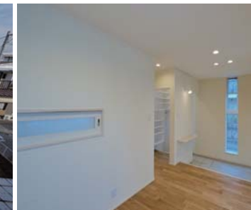
多目的な玄関ホール。左手開口部はキッチンの通気窓。左手奥は玄関クローゼット。