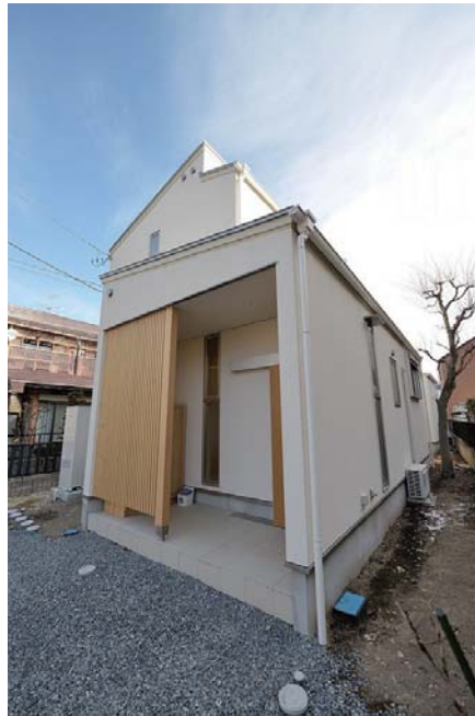
西側（道路側）ファサード。ポーチは外部収納を兼ねる。