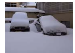
78年ぶりの大雪の朝。雪に埋もれる愛車。駐車場の一番奥のこの状態から道路に出るまでがとて大変でした。その状況はこちら。

皆様、こんにちは。2月も中旬になりました。早いものでお正月から1ヵ月半も過ぎようとしています。ソチ・オリンピックも開幕し、今のところ日本勢は本来の力を発揮できていないようですが・・・後半戦頑張ってくれると信じています。2月9日朝の仙台の大雪は右の写真やブログでお伝えしました通り、予想を超えた積もり方で本当に驚きました。私は当日の午後には仙台を離れましたが、その後もご不便な日々が続いている事と思います。仙台の方々には、お見舞い申し上げます。どうぞ足下にお気をつけて。さて、先週は年に一度の健康診断を受けました。採便・採尿や前日からの準備、採血、バリウムなど何かと大儀に思ってしまうのですが、若干の程度の検査で大丈夫だろうか？とも思っています。自分でも経年劣化が所も多く感じますし・・・今年は非常にきりのいい年齢にもなりますし、その頃に1泊2日のドックを受診してみようと思います。恐ろしいメニュー満載でしょうけど、まだまだ頑張らなければなりませんので。最後までお読みいただきましてありがとうございました。それでは次回もどうぞお楽しみに。