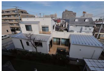
南面ファサード。1階はまだ日陰だが中庭の奥まで陽が差し込む。