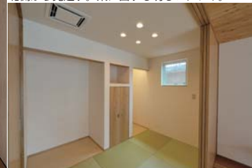
畳スペース。床の間と仏壇置場。