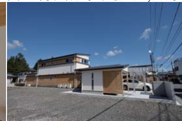
西側ファサード。木質系材料と塗壁のデザイン。