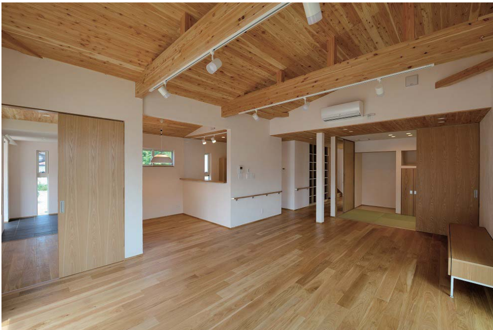
LDK。左手に玄関・ホール、右奥にフラットな畳スペース。

岩手県花巻市の中心部に建つ住宅です。敷地は、大通りから1本入り込んだ古からの通りに面して南北に長く、南側・北側それぞれに道路に接しています。このような敷地に、2人が暮らす、木造2階建ての住宅を計画しました。敷地は南北に約45メートル、東西に9メートル程度の細長い敷地で、西側は空地ですが東側には隣家が迫っています。陽当たりの良い南側にはLDKを設け、光庭としてのデッキを介して北側の個室スペースにつながります。2階は予備室的な個室になっており、年に数回の帰省時や来客時に活用します。外部は準防火地域内ながら木質系の材料も多用し、周辺とは一線を画する雰囲気を出せたのではないかと思います。内部も無垢のフローリングや天井・珪藻土の塗壁等、自然系の素材を多く採用し、落ち着いて安らぎのある空間を演出しています。