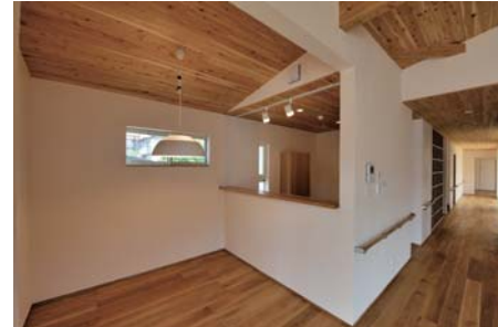
ダイニング。北側に向かう明るい通路を見通す。