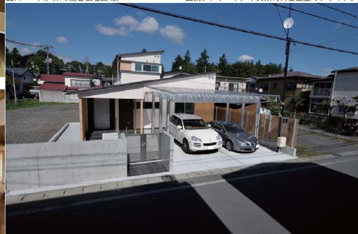
南側ファサード。ハリアフリーなアプローチと圧迫感のないカーポート。