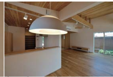
ダイニング。ルイス・ポールセン AJ Royal 500。