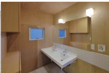
洗面脱衣室。カウンタータイプのツイン洗面台。南側のバルコニーとサンルーム。