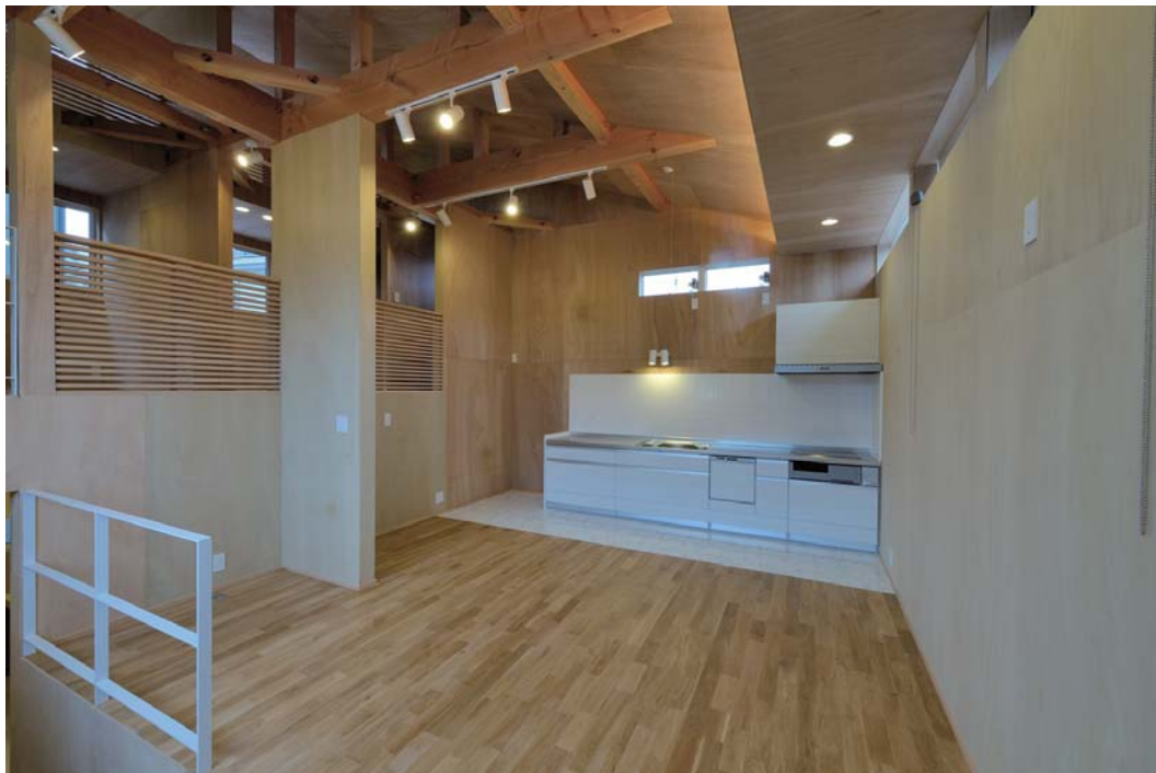
リビング・ダイニング。床はオーク無垢フローリング、壁・天井はラワン合板素地仕上げ。左上のスキップは子供室。