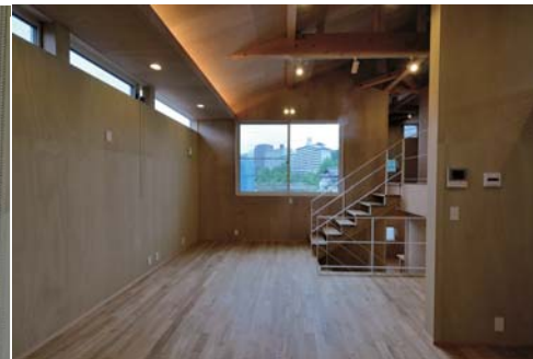
ダイニングから北方向を見る。間接照明と構造体。