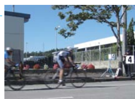
今月も息子で。@新庄クリテリウム