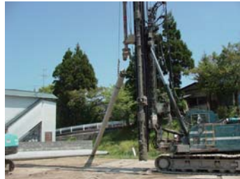
杭打ち。特殊な形状のため、いきなり入荷待ちで工程の調整が大変でした。