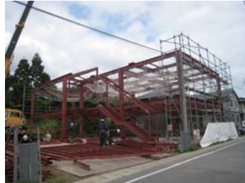
鉄骨建て方。形状が一気に立ち上がります。木造とは全く違う、物々しい雰囲気です。