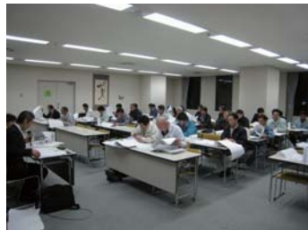
見積発注説明会。分離発注の現場は、ここからスタートします。