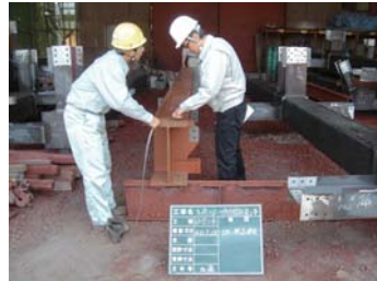
鉄骨製品検査。鉄骨工場で寸法や出来形をチェックします。溶接部は超音波検査です。