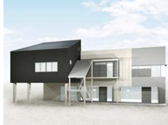
コンセプトイメージ。階段の付き方が変更になりましたが、大きな変更はありません。