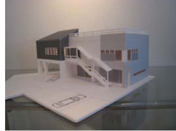
モデリング。さらにここから開口部が変更になっています。左上の鉄骨と見比べて下さい。