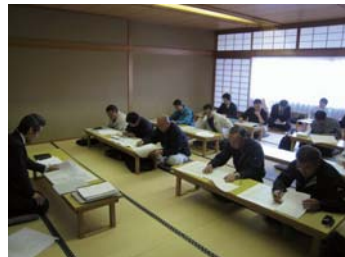
全体工程会議。タイトなスケジュールですので皆さん真剣です。