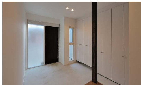
玄関方向を見返す。広い土間とたっぶりの壁面収納が出迎える。