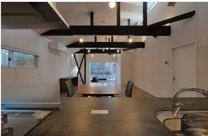
キッチンからLDを見る。視線はリビングの先のデッキから外部へと開放される。