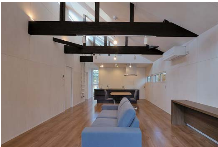
リビングからDK方向を見る。既存の住宅とは全く異なるプランニングになった。