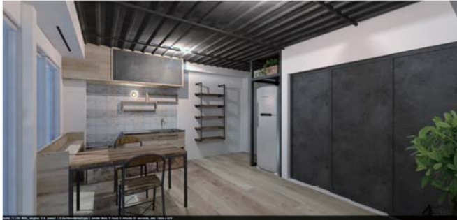
リビングからダイニングを見る。全体をモノトーンな色調としクール感を演出。