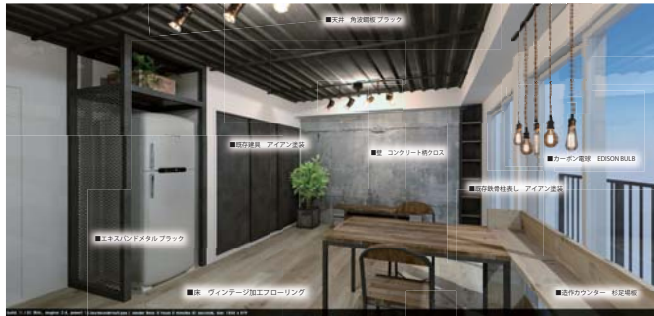
リビング、エキスパンデットメタルにアイアン塗装でヴィンテージ感を演出。