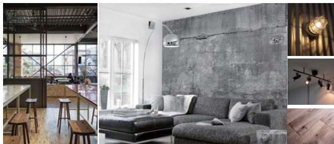
空間のイメージ。工業製品を用いたスタジオや倉庫のような雰囲気を出したい。

秋田市内の築 38 年、鉄骨造 4 階建て (24 部屋) アパートのリノベーション提案です。老朽化したアパートにそれぞれのデザインで新たな価値を付加し、新しい感覚を持つ借り手の需要を掘り起こそうとする試みです。ただしスペースは築年数相応の物件であり、工事費用は家賃として回収する事になるため、かなりのローコスト化が要求されます。いかにコストを抑えて効果的に空間をデザインしていくのか、戸建の住宅設計にも通ずるテーマでもあります。