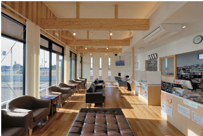
調剤薬局の待合室。右手に受付カウンターと調剤室。天井には大断面集成材の梁が露出する。床は木調 P タイル。

ニュースレター 「建築家の日常・非日常」 発行責任者：加藤 一成 株式会社 加藤一成建築設計事務所 仙台オフィス TEL：022-739-8931 FAX：022-739-8932 秋田オフィス TEL：018-831-4315 FAX：018-831-4316 HP：http://www.issei-design.com/ Blog：http://www.issei-design.com/blog/ Mail：info@issei-design.com