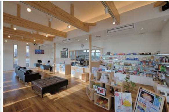
受付カウンターと OTC。カウンター上部は間接照明としてインテリアのアクセントとする。