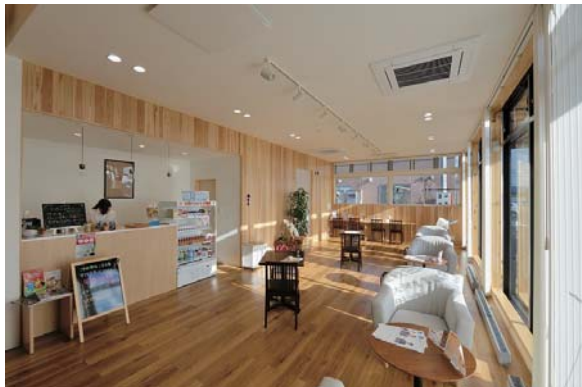
カフェをイメージしたコミュニティスペース。健康・栄養相談なども行われる。