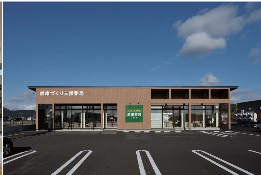
南西に面するスクエアな道路側ファサード。メンテナンス性を考慮して木調の防火サイディングを採用した。