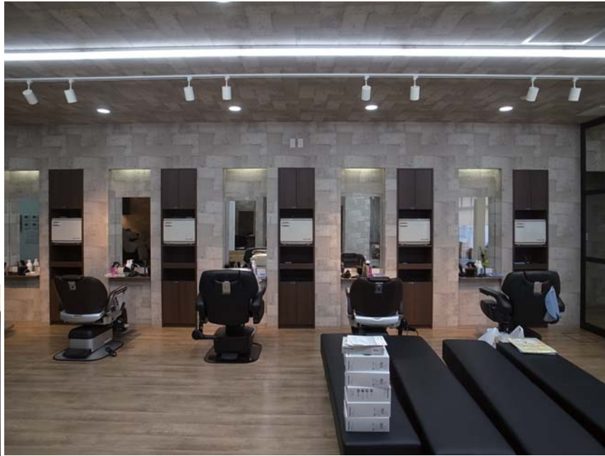
理容ゾーン。什器類は壁に埋込みとし間接照明でミラー回りを演出する。壁・天井ともコンクリート調クロス張り。

サロンはテナント改修で、もとは建設作業着等の量販店舗でした。ワンルームの既存量販店舗に、必要な機能を確保しながらレイアウトしました。やや横長の平面の中で、基本的には左右に理容・美容を振り分け、その中で機能の違いによるスペースやバックヤードとなるスタッフルームや収納部門を設けています。インテリアに関してはスタイリッシュと言うよりはやや重さの感じる素材感のあるものとしており、これらの雰囲気全てをローコストとなるクロス張りで表現しています。間接照明を随所に用い、プライス以上のリラクゼーション・スペースを提供しています。