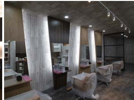
美容カットスペース。壁面の凹凸と間接照明。素材の張り分け。美容ゾーン。奥はカラーウェイティング、右手は島什器。