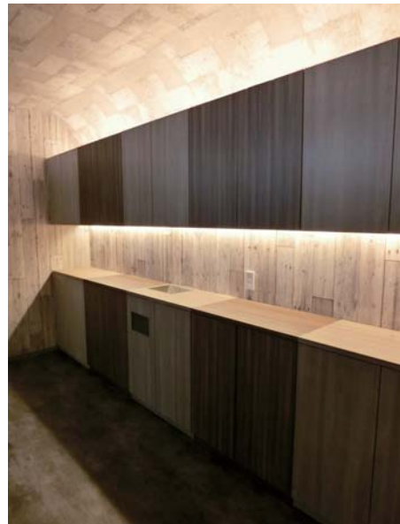
美容シャンプーゾーン。壁~天井はRとし間接照明を仕込む。